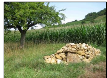
Les petites structures les plus souvent réalisées dans le cadre des projets de promotion des petits mustélidés sont les tas de branches, suivies des tas de pierres.