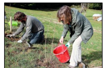
Les plantations de haies étaient beaucoup moins fréquentes.